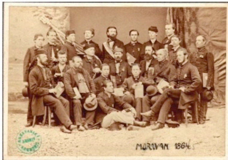
Pěvecký soubor Moravan v roce 1864