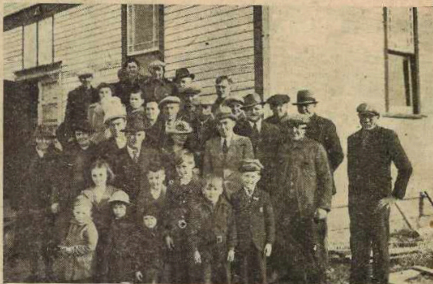
Odbočka čsl. národního sdružení v Henrichsbourgu, Kanada