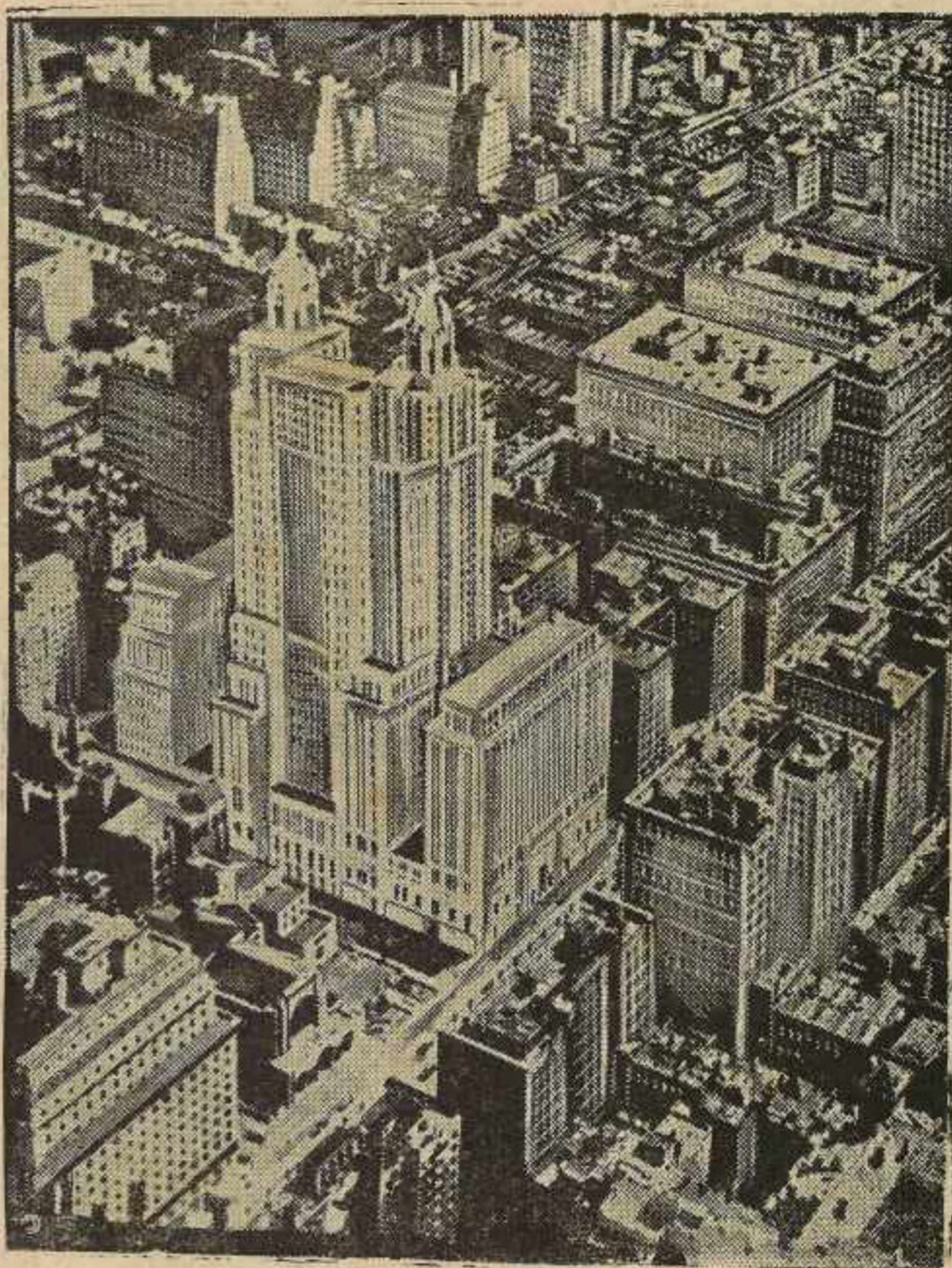
New York hlavní město USA, město s tisíci mrakodrapy, symbol nového světa, kde našlo domov tisíce Čechoslováků

Stará vlast, vsichni Volyňští a dobří vlastenci posílají v tomto čísle Věrné stráže upřímné a srdečné pozdravy s prosbou, abyste vy, naši bratři v zámoří, kteří jste čistým okénkem naší vlasti do světa, nezapomněli. Jsme šťastni, že jsme svobodni, jsme šťastni, že vás v cizině máme, neboť jste naši nejlepší propagaci, a jsme na vás hrdi. Vám všem tiskneme upřímně ruce a těšíme se, že na sokolském sletě se s vámi uvidíme... Jindřich Dušek.